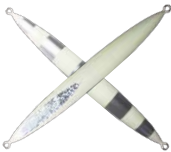
110. グローシルバーストライプ