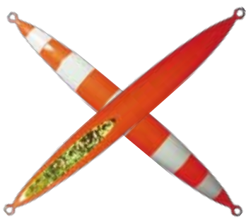
102. オレンジグローストライプ