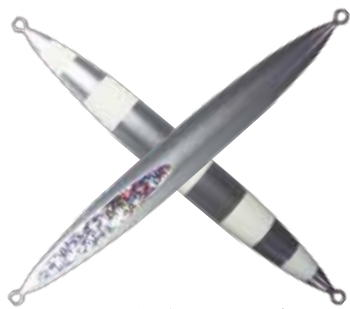
105. シルバークローストライプ