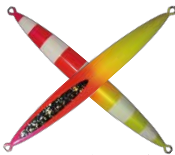
121. ピンクレモングローストライプ