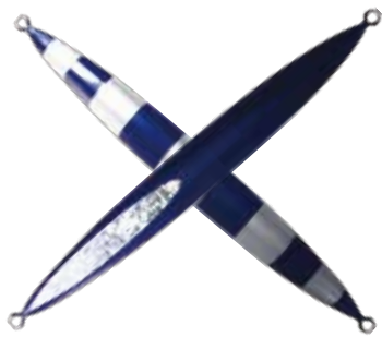
109. ブルーシルバーストライプ