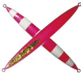
103. ピンクグローストライプ