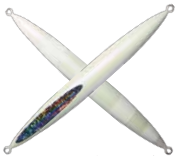
106. パールマイカグローストライプ