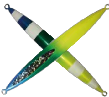
122. ブルーレモングローストライプ