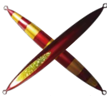
107. レッドゴールドストライプ