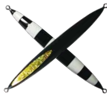
104. ブラックグローストライプ