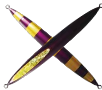
108. パープルゴールドストライプ