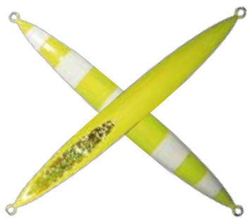
101. レモングローストライプ